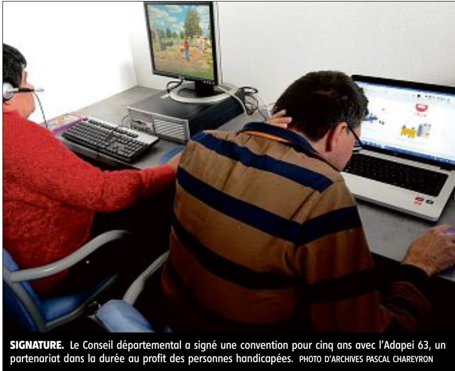
SIGNATURE. Le Conseil départemental a signé une convention pour cinq ans avec l'Adapei 63, un partenariat dans la durée au profit des personnes handicapées.

L'Adapei 63, pour sa part, gère plus d'un tiers des établissements médico-sociaux dédiés au handicap et aux personnes âgées