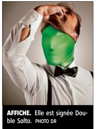
AFFICHE. Elle est signée Double Salto.

L'exposition « Anatomie du Labo », en référence à la compétition « Labo » réunit les travaux d'étudiants des écoles d'architecture, d'art et de cinéma de Clermont, Cournon, Lyon, Paris et de la Fémis ainsi que des artistes confirmés. Chacun donne une vision des films de la compétition. Cette année pour la première fois, vont participer des élèves rhônalpins : des lycées La Martinière et du SEPR (métier d'art et d'image) de Lyon.