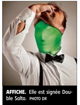
AFFICHE. Elle est signée Double Salto.

AUVERGNE ET RHÔNE-ALPES EN EXPO. L'exposition « Anatomie du Labo », en référence à la compétition « Labo » réunit les travaux d'étudiants des écoles d'architecture, d'art et de cinéma de Clermont, Cournon, Lyon, Paris et de la Fémis ainsi que des artistes confirmés. Chacun donne une vision des films de la compétition. Cette année pour la première fois, vont participer des élèves rhônalpins : des lycées La Martinière et du SEPR (métier d'art et d'image) de Lyon.